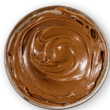
Nocciola 100% italiane