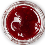
Frutti di bosco